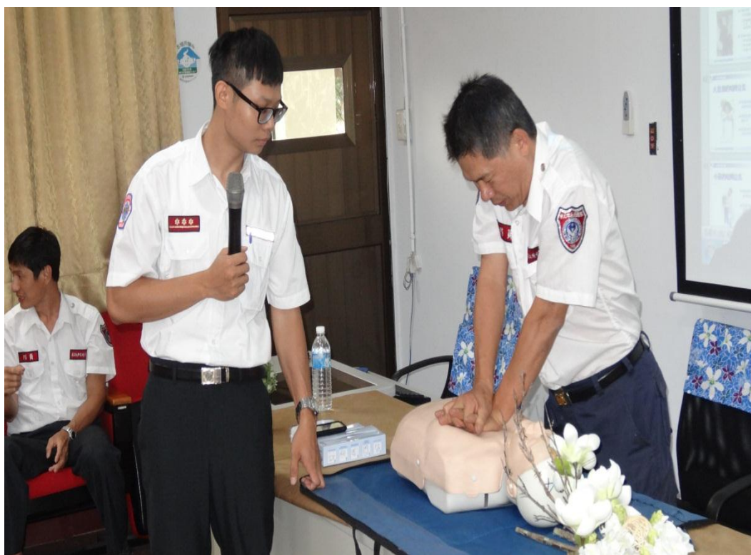
邀請南勢消防隊到校進行教職員工的 CPR 急救訓練活動