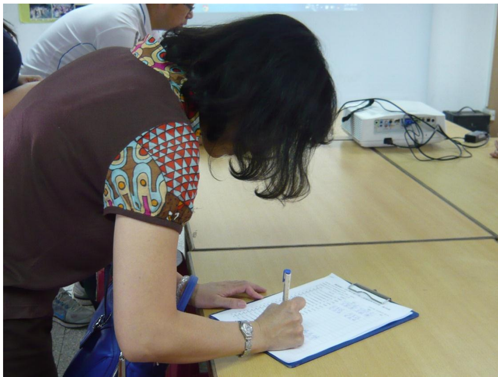
在文山農場進行環境教育研習 (103811)