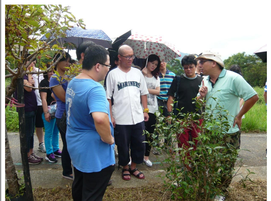
解說員仔細講解竹子的生長與茶樹的種類。( 1030811 )