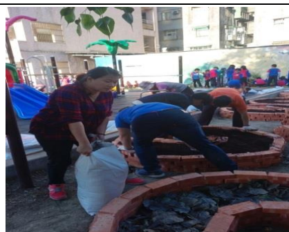
利用校園樹木落葉，進行堆肥。