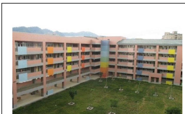
學校營造綠化活動中庭空間