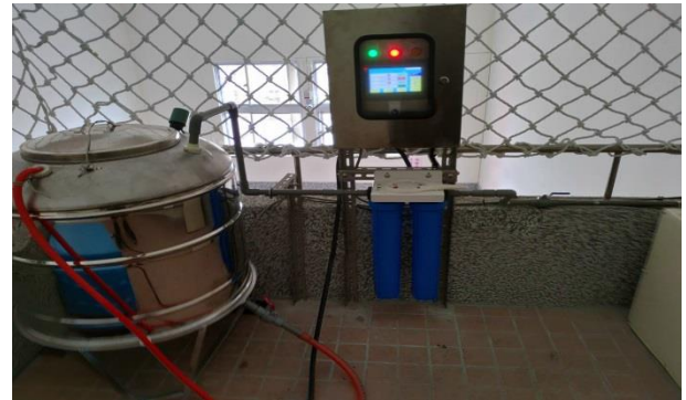
辦理屋頂多元降溫方案試運轉。