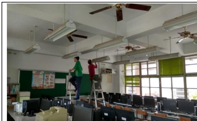
節能廠商開始到校施工--電腦教室