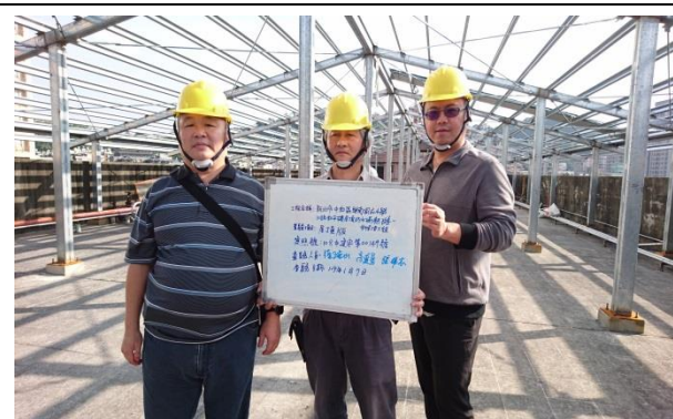
進行校園建築斜屋頂工程，防漏水又降溫，改善校園設備。