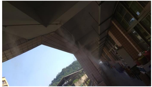
辦理屋頂多元降溫方案試運轉。