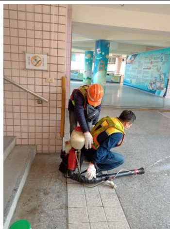
新北市環保局進行校園消毒活動