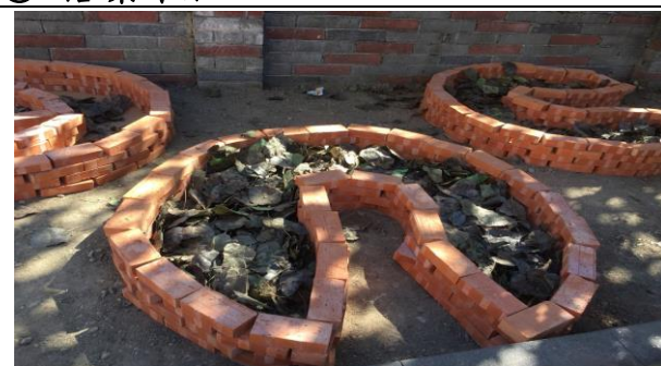
利用校園樹木落葉，進行堆肥。