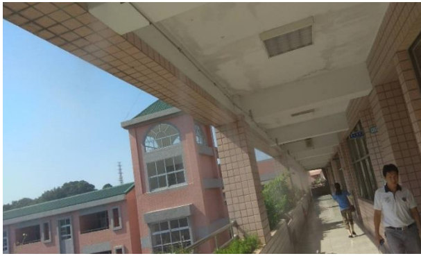
辦理屋頂多元降溫方案試運轉。