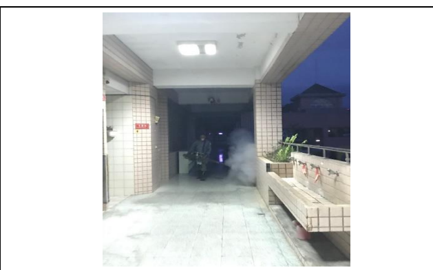
進行預防性校園室內外噴撒消毒。