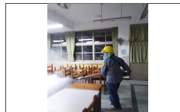
進行預防性校園室內外噴撒消毒。

◎校園消毒:定期與環保局清潔隊聯繫，進行校園室外消毒，撲滅病媒蚊； 並依需求進行室內外加強噴消。