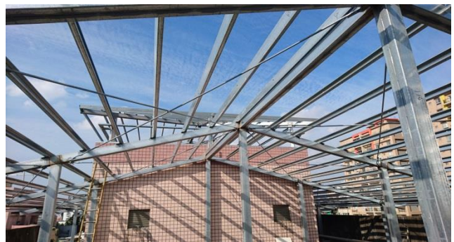
進行校園建築斜屋頂工程，防漏水又降溫，改善校園設備。