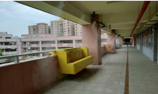
辦理屋頂多元降溫方案試運轉。