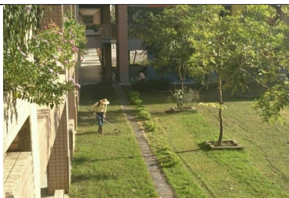
學校營造綠化活動中庭空間