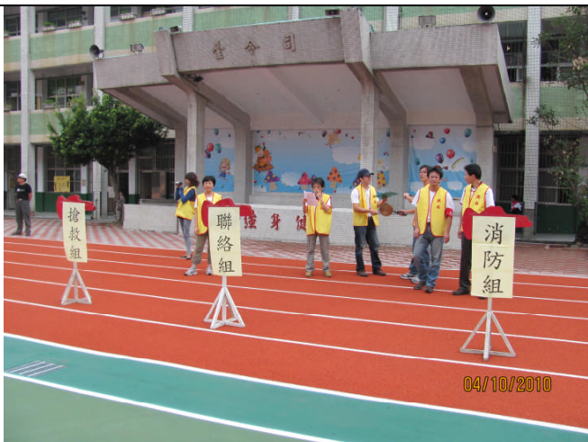
地點：操場 時間：99年10月4日 說明：由指揮官宣佈成立緊急應變中心，編組人員儘速集合。