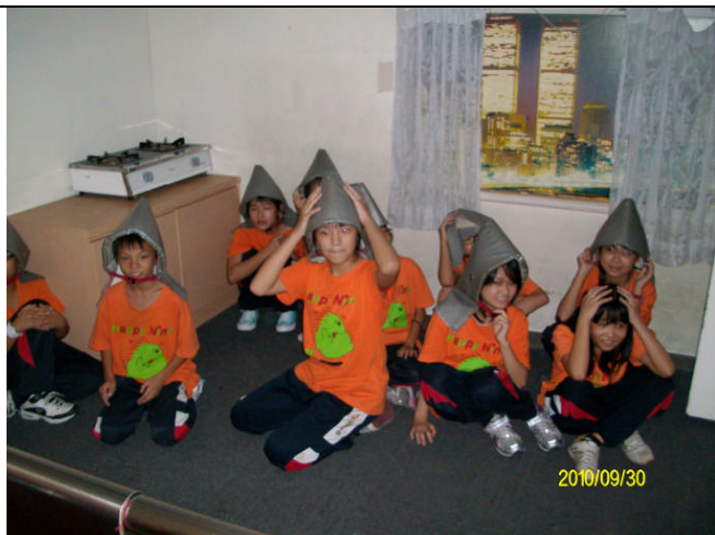
地點：內湖防災教育館 時間：99年9月30日 說明：學生輪流進入地震體驗屋練習地震時應如何自保