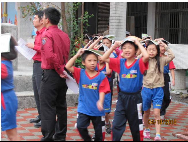
地點：操場 時間：99年10月4日 說明：主震稍歇學生以書本保護頭部，迅速逃至操場避難。