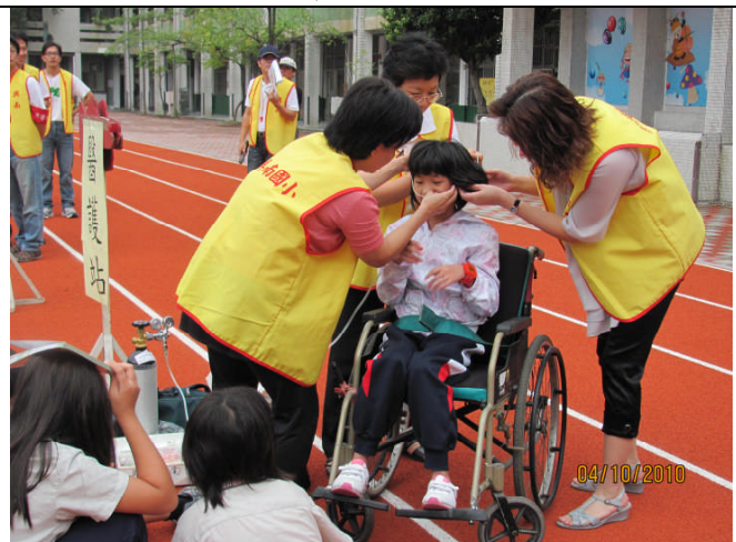
地點：操場 時間：99年10月4日 說明：醫護組搶救受困受傷的學童。