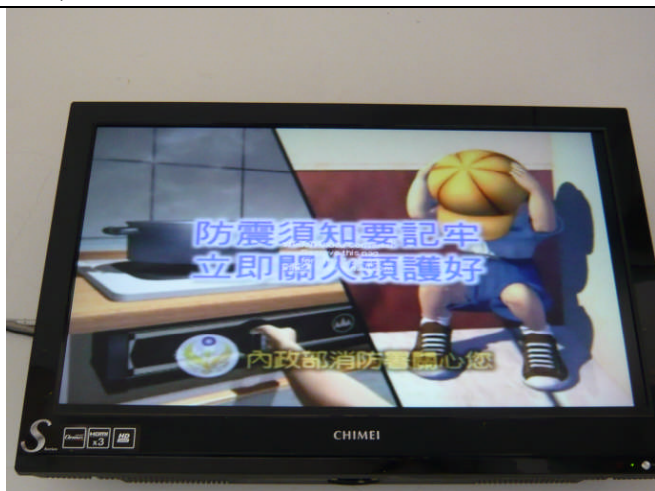
地點：一樓視聽廣場 時間：99年10月 說明：播放防災宣導短片，供全校師生觀看