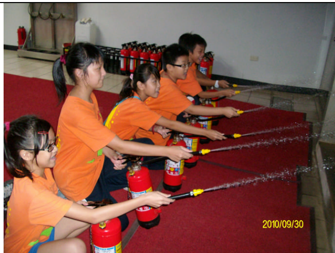
地點：內湖防災教育館 時間：99年9月30日 說明：讓學生親自操作滅火器學習滅火技巧與概念