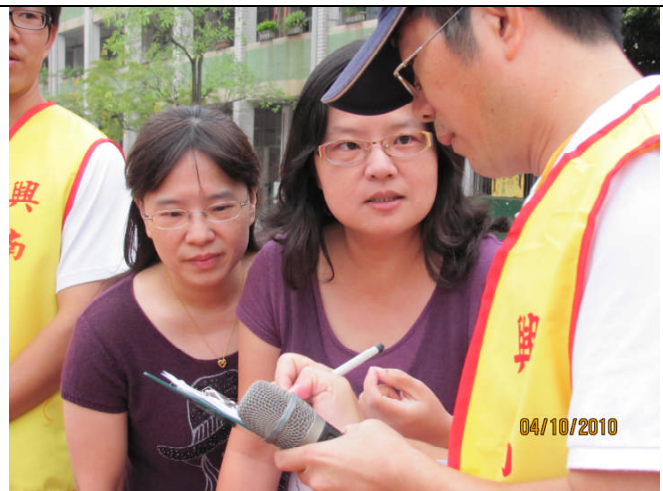
地點：操場 時間：99年10月4日 說明：各班清點後向學年主任回報，學年主任統整狀況後再向指揮中心回報。