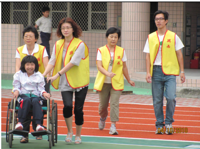
地點：操場 時間：99年10月4日 說明：學生受困教室請搶救組協助支援，並儘快後送至醫護組。