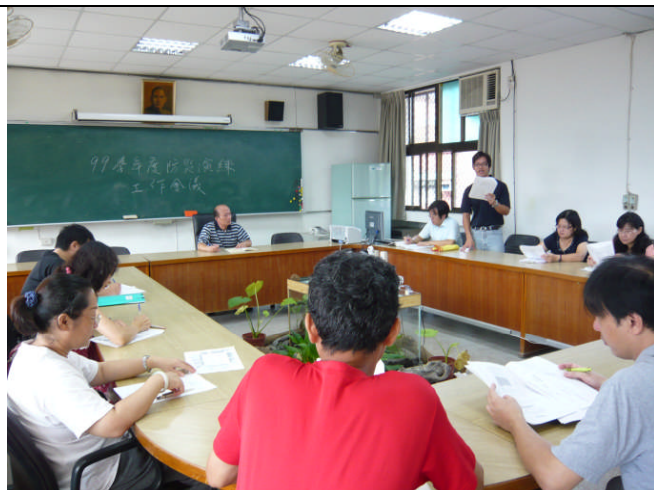
地點：三樓會議室 時間：99年9月14日 說明：召開防災逃生演練說明會，說明各處室及編組人員分工細項。