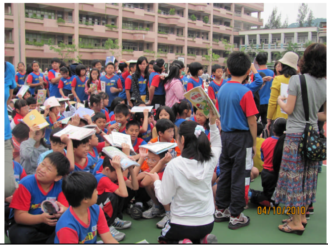
地點：操場 時間：99年10月4日 說明：學生由老師或班長帶領至安全區域，並立刻清點人數。