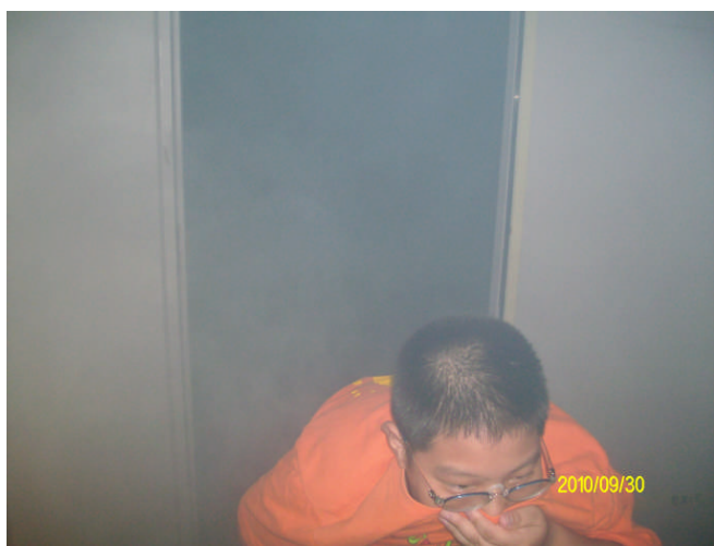
地點：內湖防災教育館 時間：99年9月30日 說明：透過火災模擬煙霧體驗讓學生了解火災逃生觀念